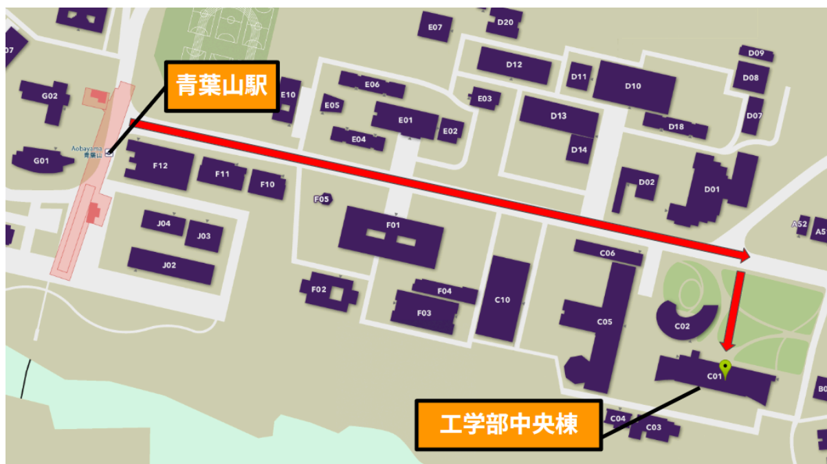
図. 青葉山駅から受付までのアクセス